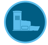
Rain-Clik Sensor Page 144