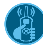
ROAM Remote Page 137