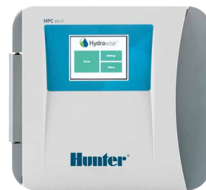
Mặt điều khiển HPC