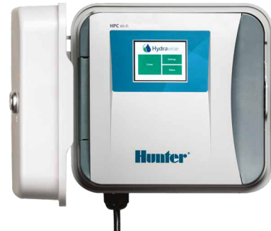
HPC (nhựa, để trong nhà / ngoài trời) Chiều cao: 22.9 cm Chiều rộng: 25.4 cm Chiều sâu: 11.4 cm